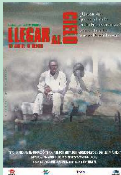
Cartel del documental "Llegar al cielo"

El evento es una importante oportunidad para conocer sobre muchos de los problemas de la diáspora africana que vive en Europa.