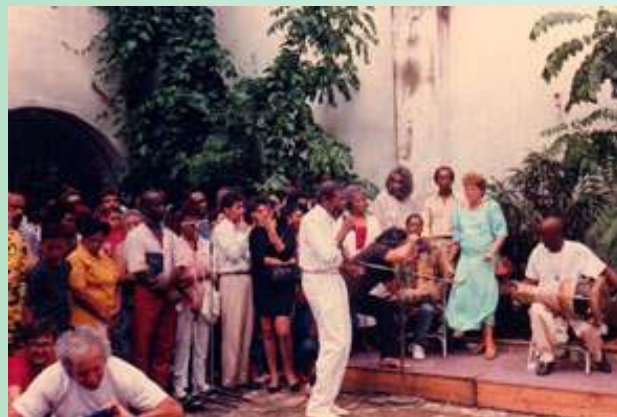
Fotograma del documental "Oggun un eterno presente"