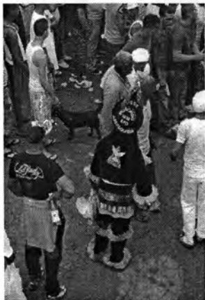
17 TALLER ANTROPOLOGIA