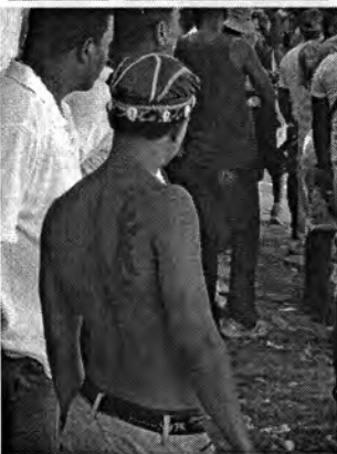
27 ANIVERSARIO CASA DE AFRICA