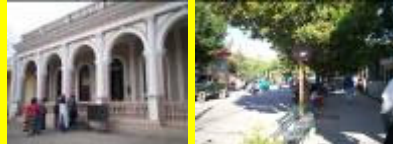
Museo y calle central de la ciudad