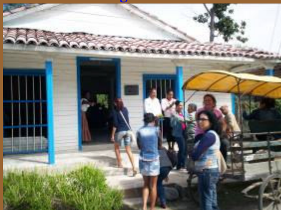
Visitantes e invitados arriban al local del Cabildo en el transporte oficial del Taller.