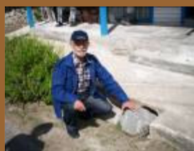
Piedra mágica del Cabildo, que no ha dejado de crecer desde su fundación en el siglo XIX. Debe ser tocada por cada visitante a la entrada.