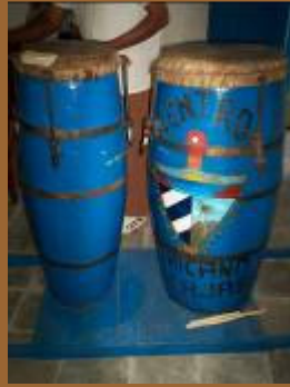
Los tambores del toque Makuta.