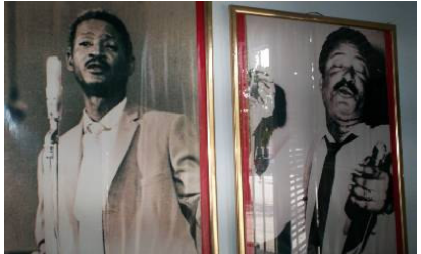
Fotografías del inolvidable artista lajero en el museo de la localidad.

En Santa Isabel de Las Lajas se realizó el I Taller Municipal de Tradición e Identidad, auspiciado por la Dirección Municipal de Cultura de la ciudad, cuna de popular cantante cubano Benny Moré, el Bárbaro del Ritmo. Un programa variado de conferencias y actividades artísticas se realizó en el marco de las actividades conmemorativas del 47 aniversario de desaparición física.