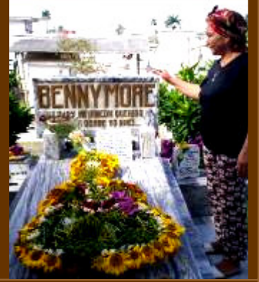
La tumba de Benny Moré.

Diseño, fotos y textos: Prof. Manuel Rivero Glean: mrglean@eaeht.tur.cu