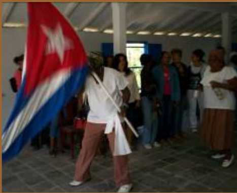
El Cabildo Congo de San Antonio.