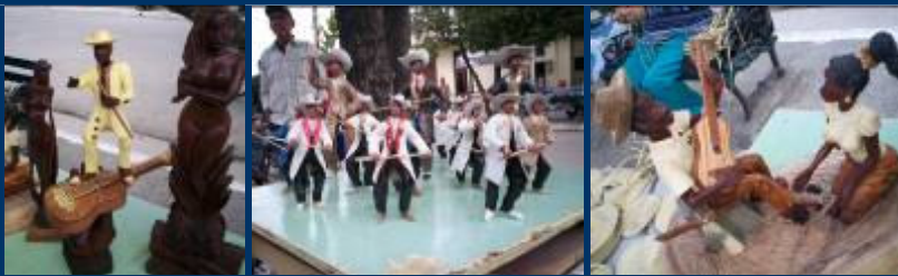
La artesanía lajera, inspirada en el inmortal Bárbaro del Ritmo