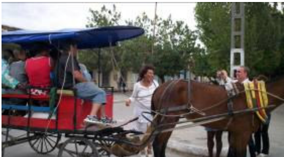
El tradicional coche de Lajas, convertido en transporte oficial de invitados y organizadores.