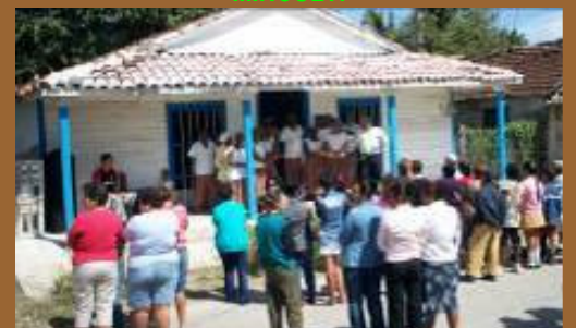
El local del Cabildo bantú, poco antes de ser anunciado su reconocimiento como Manifestación Portadora de la Cultura Cubana por parte de la Comisión Nacional de Salvaguarda del Patrimonio Inmaterial del MINCULT.