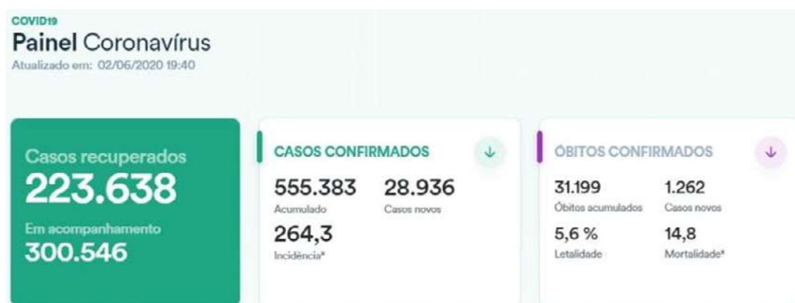
Cuadro 1: Distribución de los casos de COVID-19 en Brasil.